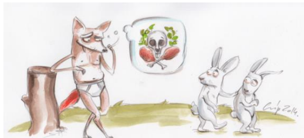
Een vos verliest wel zijn haren, maar niet zijn streken.

Wat is de betekenis van het eerste spreekwoord?